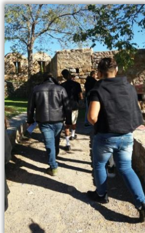
Περίπατος στο Κάστρο