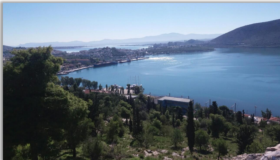
Άποψη της Χαλκίδας από το Κάστρο Καράμπαμπα

Θέμα: Εκπαιδευτική εκδρομή στο Κάστρο Καράμπαμπα στη Χαλκίδα για τους ασυνόδευτους ανηλίκους που φιλοξενούνται στο πρόγραμμα φιλοξενίας ανηλίκων "Safe Zone" που λειτουργεί ο Ε.Ε.Σ. εντός της δομής στη Ριτσώνα