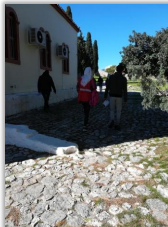
Διαδρομή προς το μουσείο