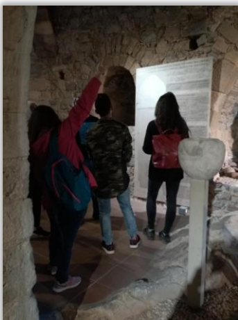
Ξενάγηση στο μουσείο